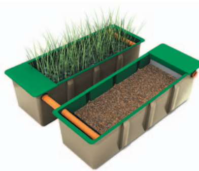
FILTRES PLANTÉS DE ROSEAUX